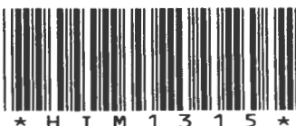
Chart Location: Consents

Translated by UNC Health Care Interpreter Services, 6-14-17